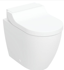
Figura di esempio